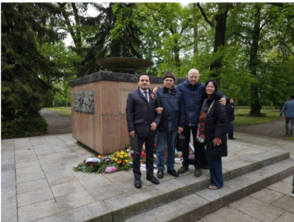
Deutsch-Russländische Gesellschaft e.V. Wittenberg