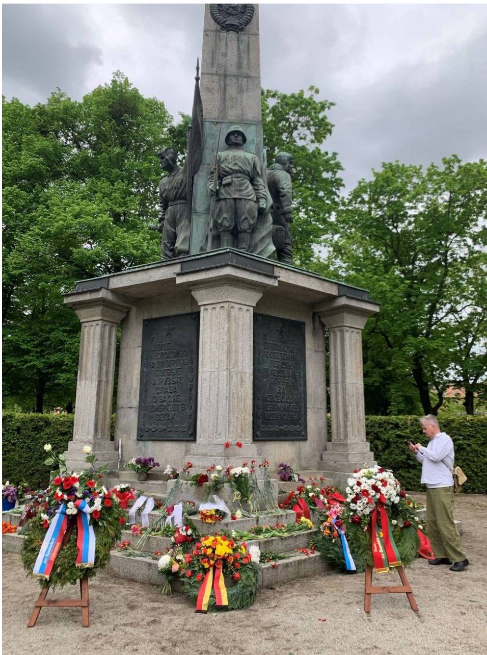
Blumen und Kränze am Obelisk für die gefallenen Rotarmisten