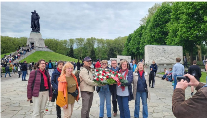
Go East Generations: Kranzniederlegung am 9. Mai in Treptow