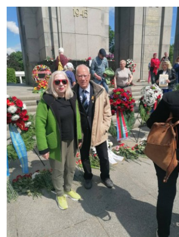
Am 8. Mai im Tiergarten