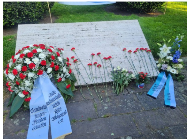
Verein zur Förderung der Städtepartnerschaft Köln–Wolgograd