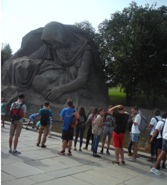
Mater Dolores in Wolgograd