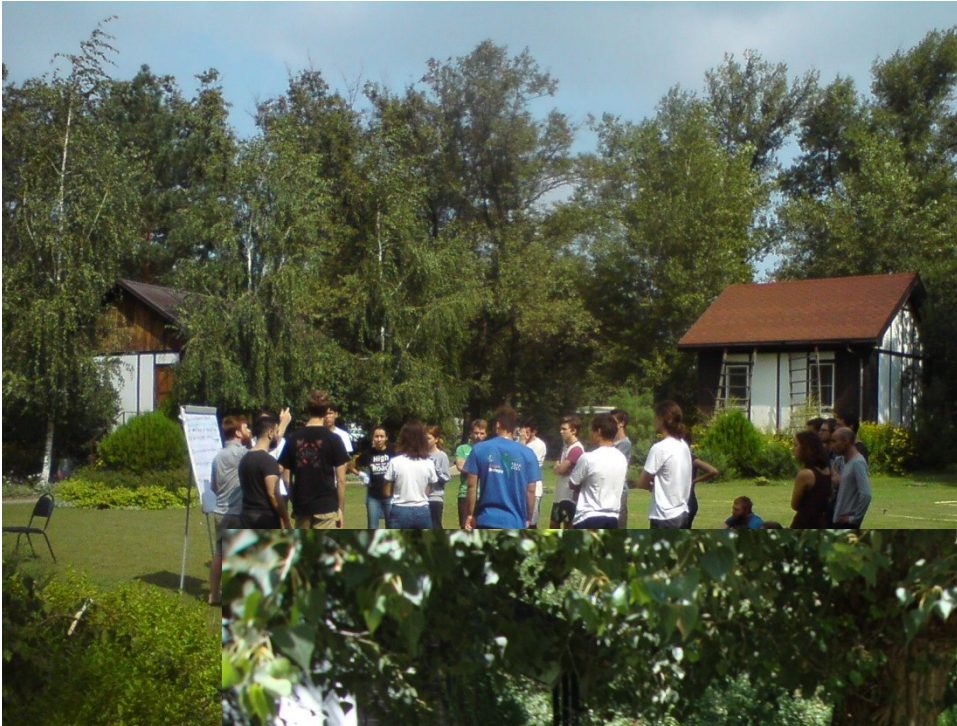
Open Air Look

Ein Herz für Musik Das Open Air Konzert im Park