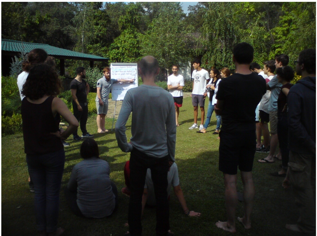
„Zuschauen ist Trumpf“