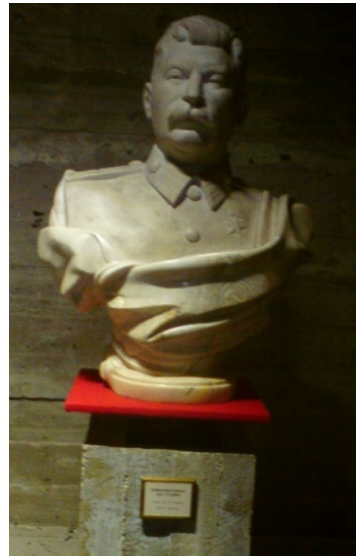
Stalin im Panorama Museum