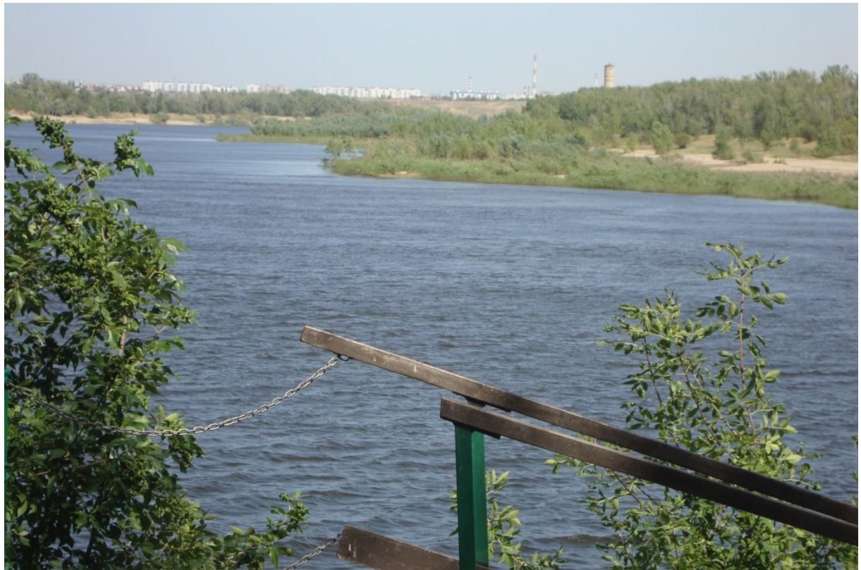
An der Achtuba