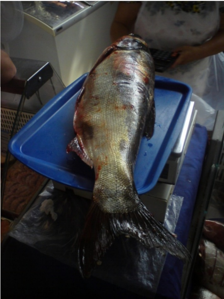
Der Fisch für den Grill aus dem Don